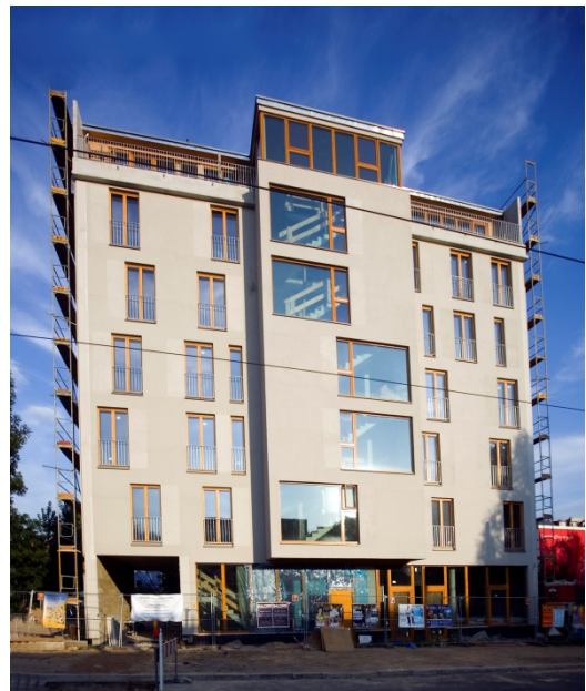
Leuchtturm eG (Erbbaugrundstück)