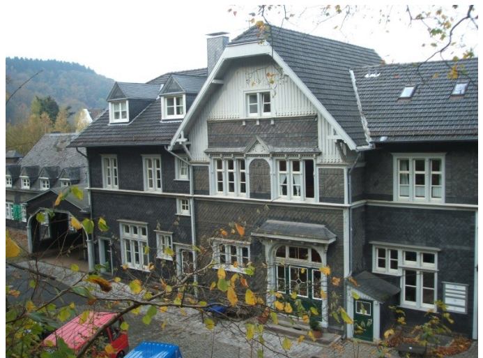
Alter Bahnhof Wuppertal-Beyenburg (Fachschule für Heilerziehungspflege, Wohnungen für psychisch Kranke)