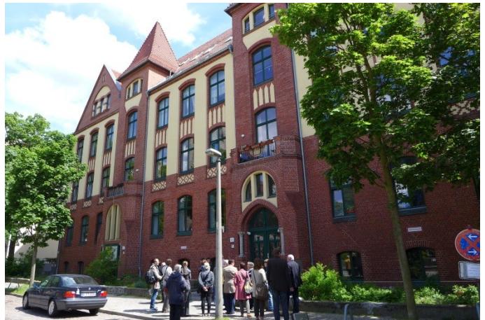
Alte Schule Karlshorst (Erbbaugrundstück)